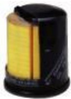
新品の オイルエレメント

エンジンオイルをろ過し、汚れを取り除くのがオイルフィルターです。定期的な交換を行わないとフィルターの目詰まりにより潤滑不良になりエンジンに重大な損傷を与える恐れがあります。