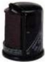
1万km後の オイルエレメント